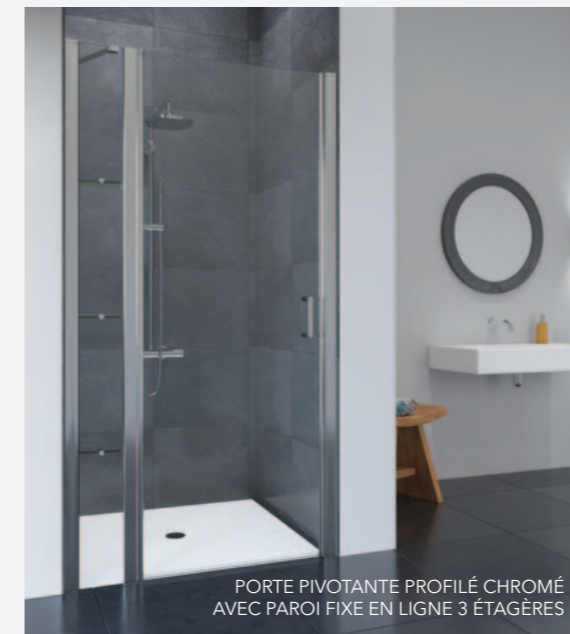
PORTE PIVOTANTE PROFILÉ CHROMÉ AVEC PAROI FIXE EN LIGNE 3 ÉTAGÈRES

Accès sans seuil à l'espace de douche. Possibilité de fermer la porte sur la paroi en ligne ou le mur. Si la paroi en ligne est montée avec une paroi latérale alors la paroi en ligne doit être montée entre la porte et le mur.