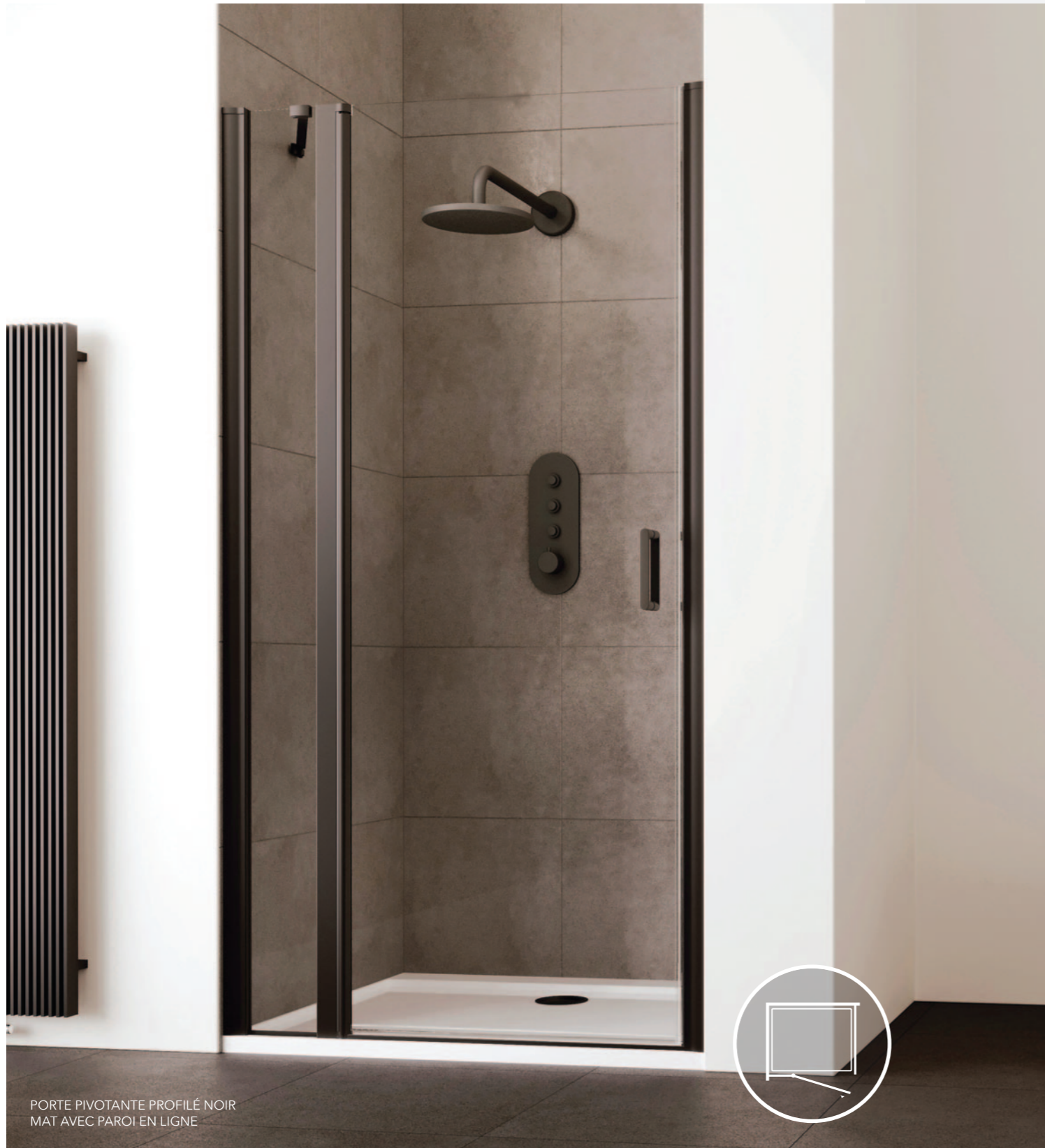
PORTE PIVOTANTE PROFILÉ NOIR MAT AVEC PAROI EN LIGNE